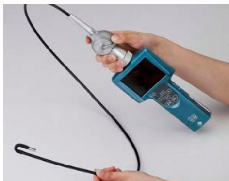
SONDA FLESSIBILE ARTICOLATA OPZIONALE