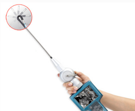
SONDA RIGIDA ARTICOLATA OPZIONALE