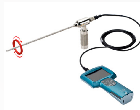
SONDA RIGIDA OPZIONALE