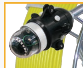
Telecamera Robotizzata Opzionale